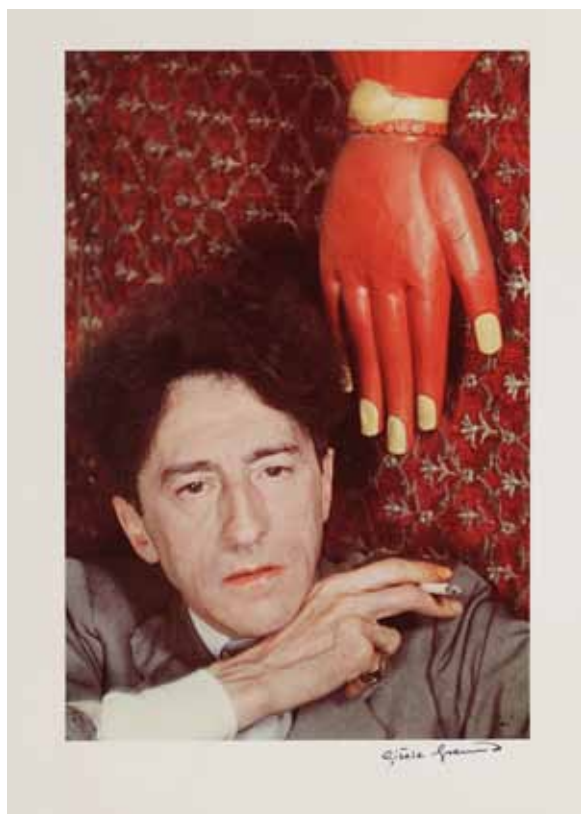
Jean Cocteau , Paris, 1939