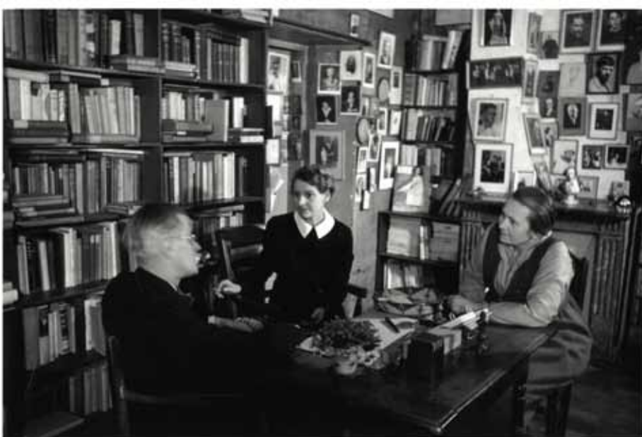
James Joyce, Sylvia Beach et Adrienne Monnier à La Maison des Amis des Livres, Paris, 1938