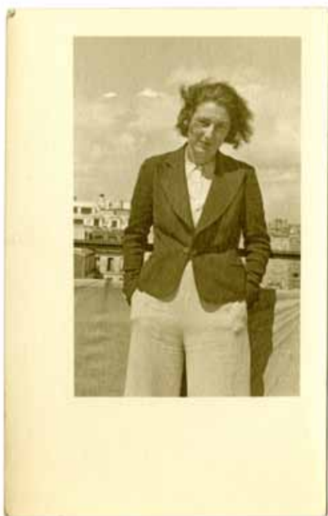
Gisèle Freund, rue Lakanal , autoportrait, Paris, 1934 Carte postale N&B, 10 x 6 cm

Textes de Gisèle Freund, Christian Caujolle, Catherine Thieck et Olivier Corpet, Lorraine Audric Biographie illustrée de Gisèle Freund par Elisabeth Perolini